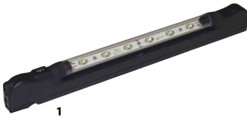
1 Éclairage 19"/1U avec LED, 230 ou 110-240 V