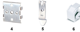
4-5 Placas adaptadoras para montaje en carril DIN 6 Cubierta