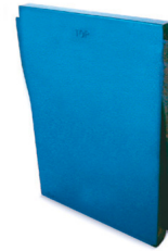
Dispositif de suspension LZ 1010