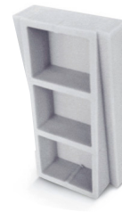
Aufhängung LZ 1006