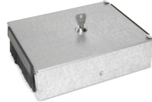
Caja de puntos de consolidación, 6 puertos, con tapa y cierre (opcional)