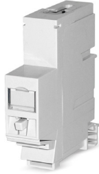
Adaptador de carril para 1 módulo RJ45 MS-K 1/8 o MS-K Plus 1/8

para 1 módulo RJ45 MS-K 1/8 o MS-K Plus 1/8