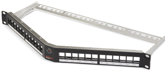
Panneau de brassage blindé KS 24x-a, angulaire