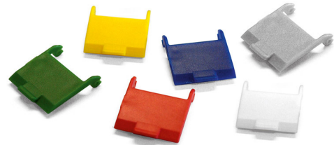
MS-C6A 1/8 Cat.6A (IEC) 180°-K (Keystone) Módulo RJ45 y tapas de protección contra el polvo