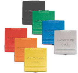
Module MS-K Plus 1/8 Cat.6A, afgeschermd, met stofluikje