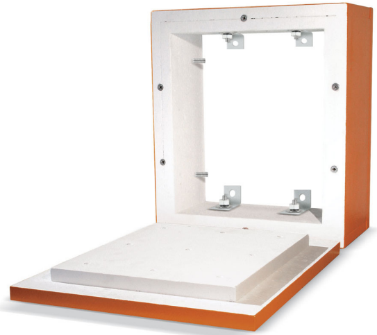
Cubierta para caja tipo Hércules AHD E30-E90